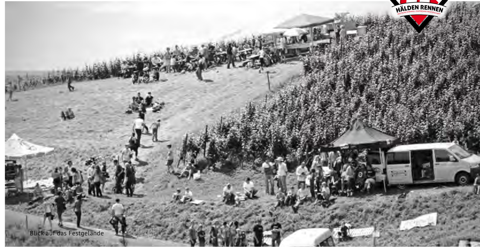
Blick auf das Festgelände